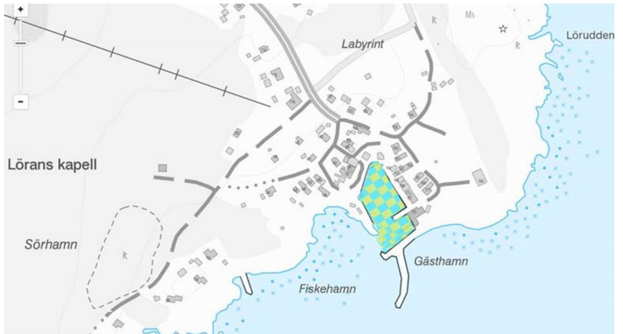
Figur 5. Lörans hamn med hamnområde mellan kajanläggning/strand och markerad gräns.