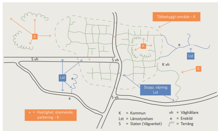
Figur 1 Beslutsmandat lokala trafikföreskrifter

Det finns två typer av trafikregler – allmänna och särskilda. Allmänna trafikregler beslutas av regeringen. De gäller i hela Sverige och tillkännages av Sveriges riksdag genom Trafikförordningen (1998:1276). Särskilda trafikregler kallas lokala och andra trafikföreskrifter. I Timrå beslutas de flesta lokala trafikföreskrifterna av Kultur- och tekniknämnden, men en del beslut fattas av Länsstyrelsen eller Trafikverket.