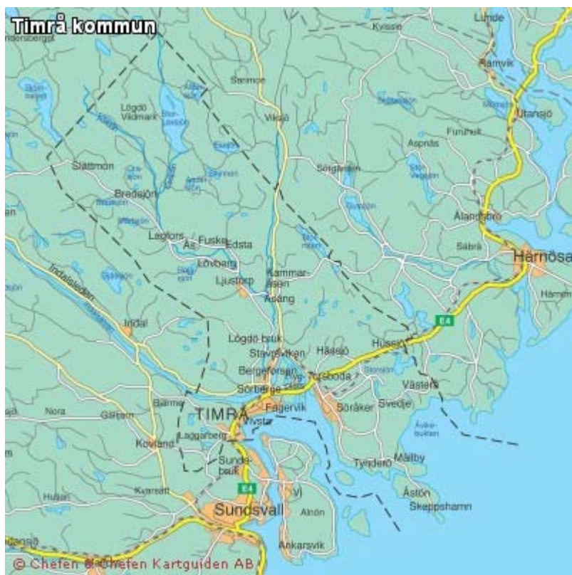
Tabell 1 Timrå i siffror

Kommunen omfattar de fyra medeltida socknarna Timrå, Ljustorp, Hässjö och Tynderö och antalet innevånare är knappt 20 000.